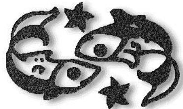
Ihr Sternzeichen: Fische