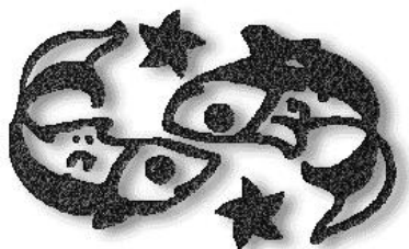
Ihr Sternzeichen: Fische