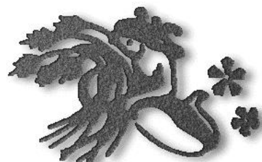
Ihr Sternzeichen: Jungfrau