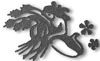
Ihr Sternzeichen: Jungfrau