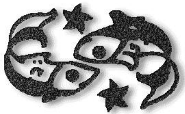
Ihr Sternzeichen: Fische